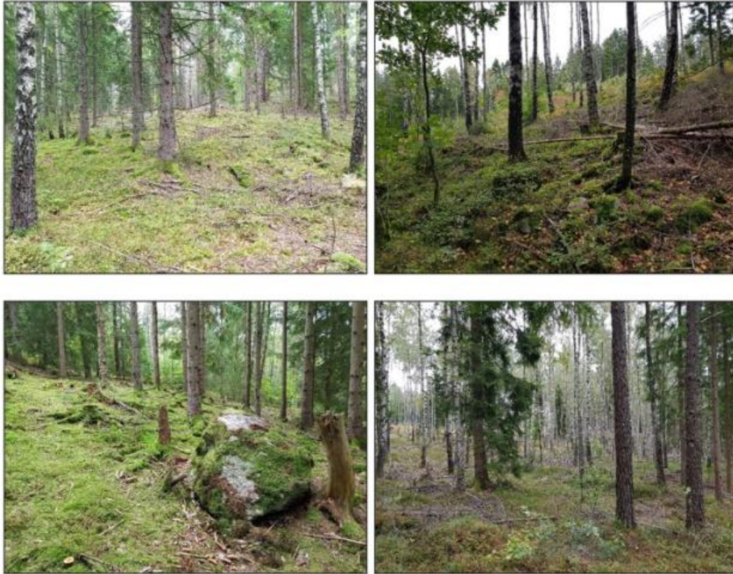
Figur 2-5, Typbilder från området.